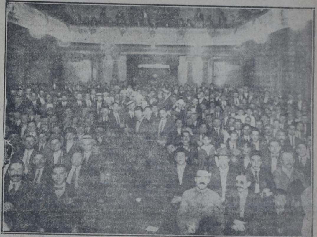
En el salón de la Casa Suiza, poco antes de iniciarse el magnífico acto

los "salvadores" de Italia para alzar el peligro del bolchevismo?